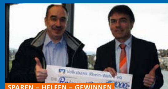
SPAREN – HELFEN – GEWINNEN

Die Garde des Hotzen-Neunerrats Görwihl freut sich über einheitliche Mäntel.