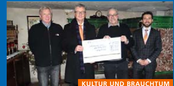
KULTUR UND BRAUCHTUM

Anschaffung einer Erste-Hilfe-Tasche mit Defibrillator für die Einsätze der First Responder Laufenburg-Murg.